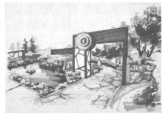
图6 沈阳园 Fig.6 Shenyang garden