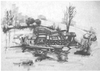
图1 嘉兴园 Fig.1 Jiaxing garden

格,使希望表达的概念具有直观效果,使人们与场所精神进行对话和共鸣 [7] 。如长春园以立体电影胶片雕塑暗示电影城的特色,以白色卵石铺装来体现长春北方雪城的地域特色(图5)。宁波园整个游园形似一本打开的书籍,融合天一阁、古商船、世界地图等设计元素,很好地展现了宁波“书藏古今,港通天下”的主题。又如沈阳园入口嵌有齿轮的红色景墙,很好的表达了沈阳东北老工业基地的城市特征,给人留下了深刻的印象(图6)。