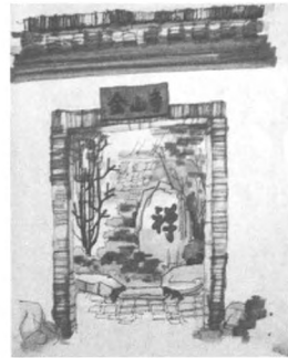
图3 杭州园 Fig.3 Hangzhou garden