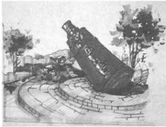
图2 宝鸡园 Fig.2 Baoji garden