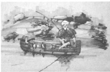
图4 桂林园 Fig.4 Guilin garden