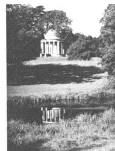
图2 西方宗教建筑与园林建筑对比