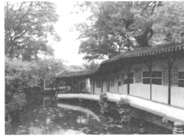
图1 中国传统住宅建筑与园林建筑之间没有根本差异