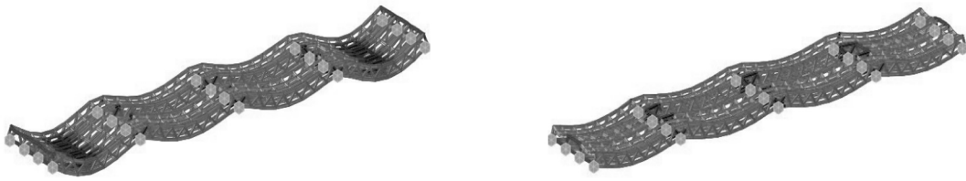
图2 结构变形验算分析图

活载挠度 (单位: mm), f_{活}=31 \text{ mm} f/L=1/1450