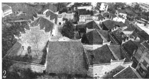
图2 特色建筑“封火筒子”

古朴精美的特色建筑。古街传统建筑以土文化结合的“封火筒子”独具特色,其多为一楼一底穿斗式木结构或砖木结构廊柱建筑,双坡青瓦屋面,两进三横四天井或三进四横六天井,四周有凸型盒砖封火围墙(图2);旧时有“永诚”、“益和”、“复康”、“集丰”四大壮观的商号建筑。