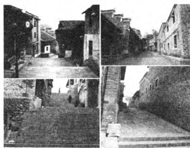
图1 洪安古镇街巷空间

婉转错落的街巷空间。长约400m的洪安古街是我国传统码头集镇商业街巷典型形态。其依山就势,婉转起伏,青砖黑瓦,庭院深深,空间尺度宜人,古朴凝重而自然(图1)。