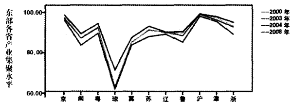
图1 东部各省市产业集聚水平变化图

为了更加直接的看到河北省产业集聚水平与东部其它地区省份产业集聚水平的比较,引进了SPSS17.0统计软件对表1中的数据进行了处理,同时考虑到了视觉效果的问题,选取东部各省市有代表性的2000年、2003年、2004年和2008年的数据进行处理,得到了东部各省市产业集聚水平变化图,如图1所示。