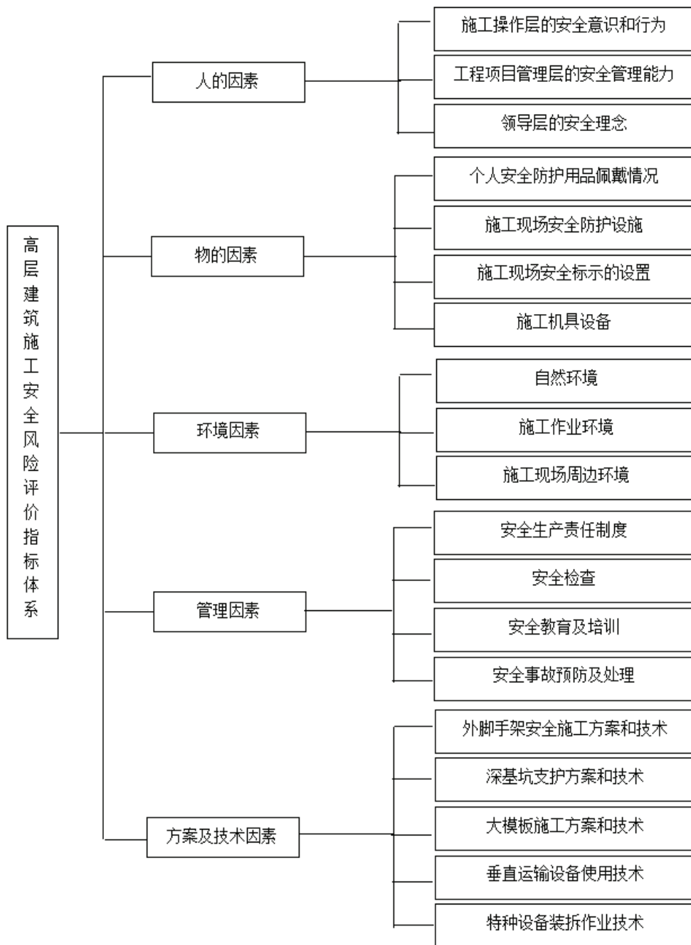
图 2 高层建筑施工安全风险评价指标体系

足”、“工作面立足点不可靠”、“交叉作业”等基本因素可以归类到作业环境影响指标内，按照这个方法总结出高层建筑施工安全风险评价的二级指标，进而构建高层建筑施工安全风险评价指标体系，如图 2 [5]